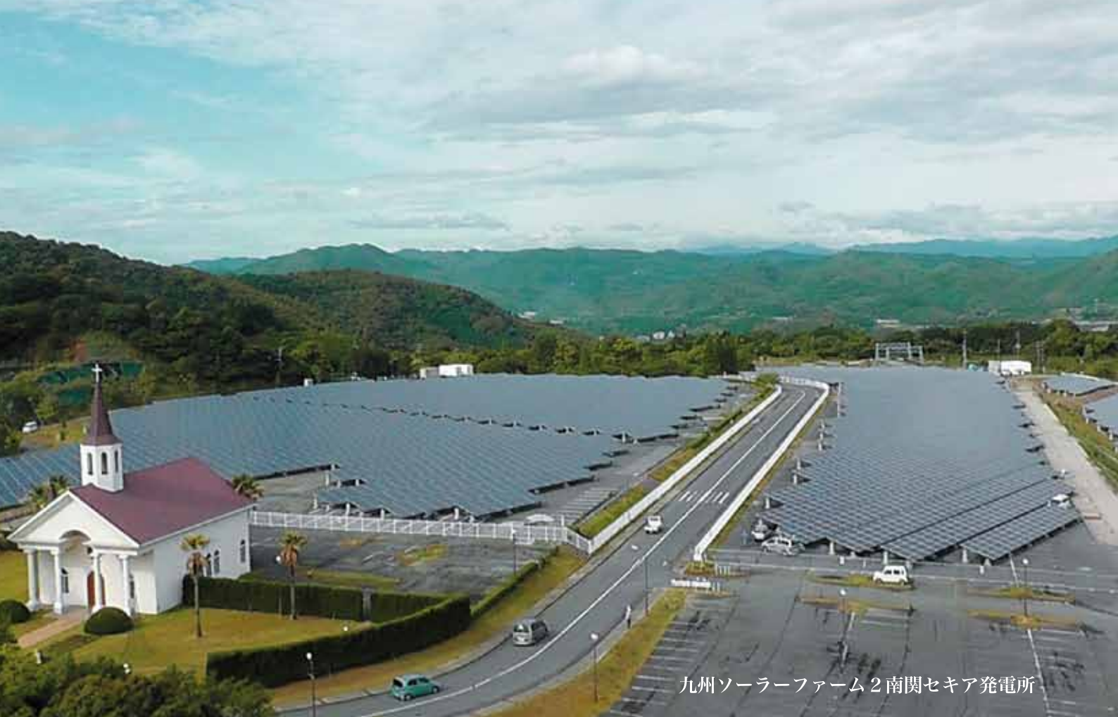
九州ソーラーファーム2南関セキア発電所