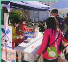
ガストロノミーポイント