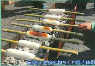
日奈久温泉名物ちくわ焼き体験